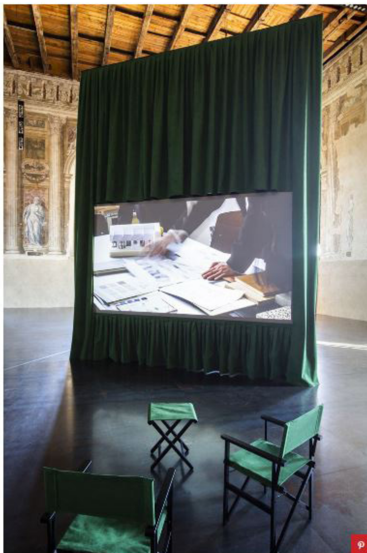
Il making of della prossima installazione firmata Neri & Hu per Studio Visit. Alcantara-Maxxi Project

Oggi parte della collezione permanente del MAXXI Architettura, le opere sono state trasportate virtualmente in Laguna e ad esse si aggiunge una nuova, in anteprima, il progetto di Neri & Hu. I due noti architetti e designer cinesi svelano qui il concept di 'Transversing Thresholds', a novembre prossimo svelata al Maxxi, il loro personale confronto creativo con uno dei pilastri dell'architettura italiana e internazionale, Carlo Scarpa. Il concetto di 'soglia' protagonista degli ambienti scarpiani è un termine caro anche alla cultura asiatica ('ma' in giapponese e 'jian' in cinese) e diventa in questa installazione il cardine attorno a cui ruota la speculazione del duo, che crea un ponte simbolico tra oriente e occidente. A determinare il contrappunto rappresentato dal termine, l'accostamento creativo di materiali Alcantara.