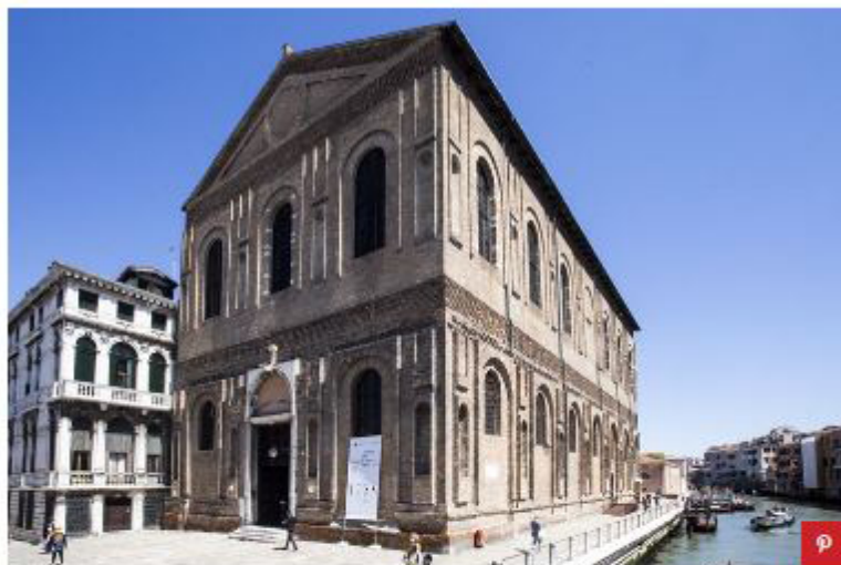
La Scuola Grande della Misericordia di Venezia.

Scoperto da un giapponese negli anni 90 grazie a una joint venture tra l'italiana Eni e la nipponica Torai, orgogliosamente ideato e fabbricato in Italia e con una virtuosa filiera sostenibile, Alcantara dimostra oggi come allora la sua visionarietà. Gettando ponti tra oriente e occidente e alimentando uno scambio fruttifero di conoscenze trasversali e interdisciplinari che oggi più che mai risuona come chiave di volta per il futuro.