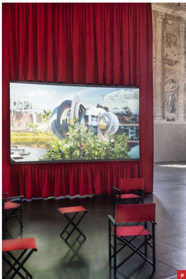
L'onirico progetto di Konstantin Grcic per Studio Visit. Alcantara-Maxxi Project

“La collaborazione di Alcantara con il museo Maxxi è di coproduzione di progetti di ricerca” spiega la curatrice. Con ‘Arch-Arcology’ Nanda Vigo aveva inaugurato la serie scegliendo l’architettura di Paolo Soleri, interpretando ‘Space IV’, un grande disegno di una città stellare immaginifica fatta dal visionario architetto, con un’estrusione tridimensionale illuminata da una luce blu elettrico. I Formafantasma avevano rielaborato il genio di Pier Luigi Nervi trovando un dialogo sinergico tra il suo materiale d’elezione, il ferro-cemento, e il tessuto Alcantara, come tra la geometria rigorosa dell’archivio realizzato e donato dal maestro e la struttura dell’Instagram del duo; l’opera si chiamava ‘Nervi in the making’. Mentre Grcic, con ‘L’immaginazione al potere’, aveva dato libero sfogo alla fantasia legando in un paesaggio fantastico e onirico le suggestioni delle lezioni di tre visionari progettisti del Dopoguerra, Sergio Musmeci, Giuseppe Perugini e Maurizio Sacripanti, e la contemporaneità di Bernard Khoury, architetto libanese di oggi, riuscendo a comporre una narrazione vivida e intensa che parla di rapporto naturale/artificiale e uomo/tecnologia.