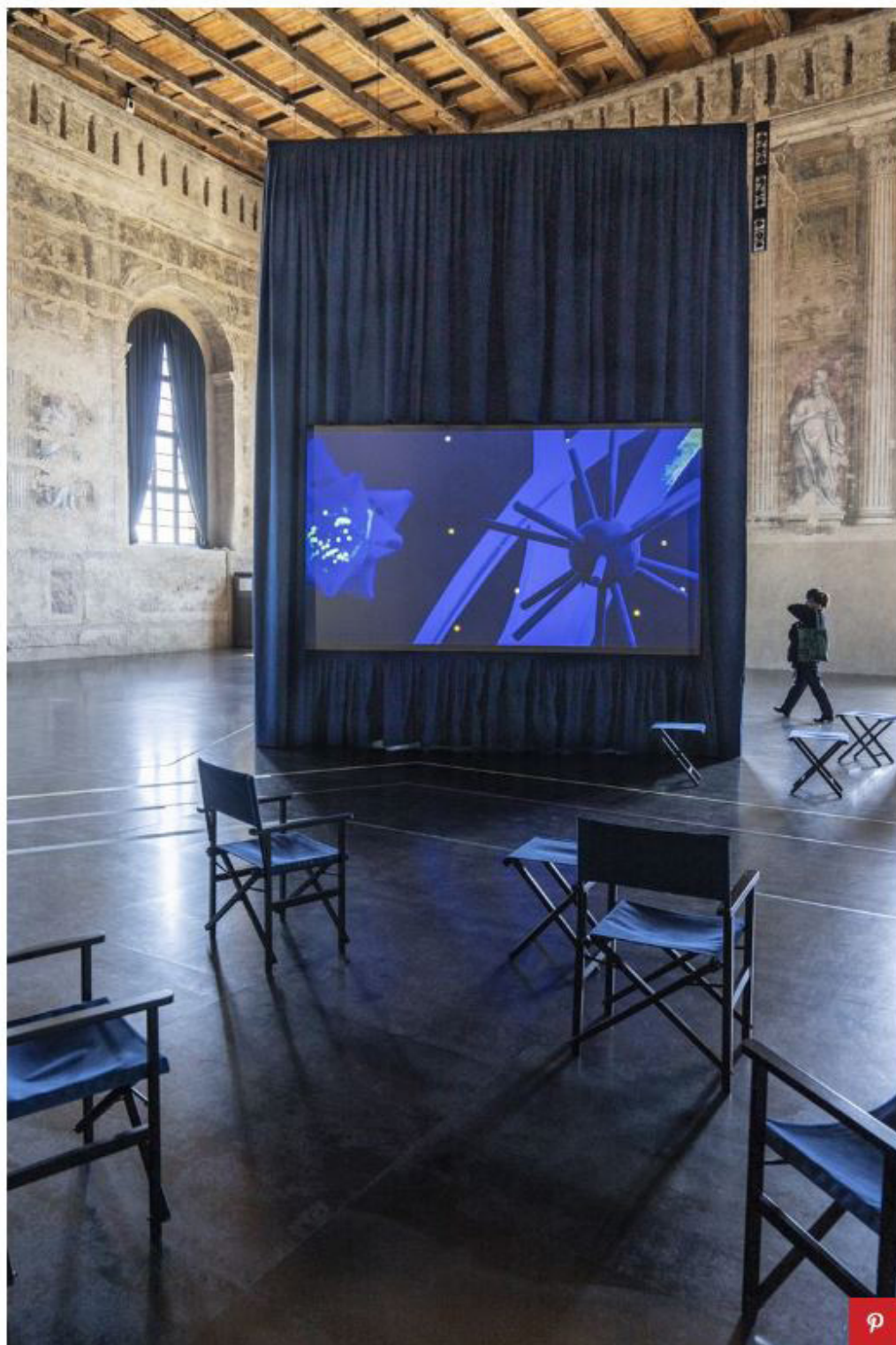
L'installazione dedicata all'opera di Nanda Vigo per Studio Visit. Alcantara- Maxxi Project alla Scuola Grande della Misericordia di Venezia